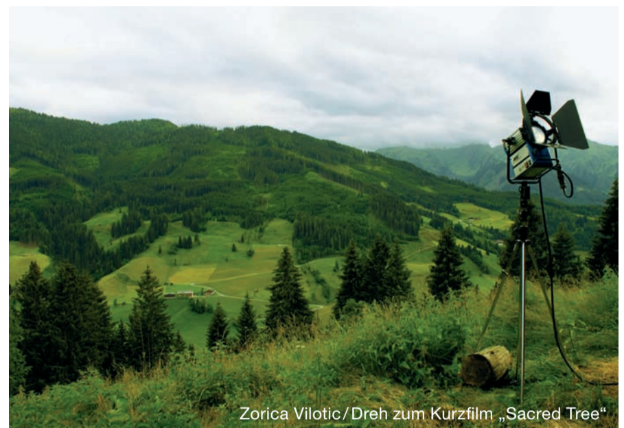
Zorica Vilotic/Dreh zum Kurzfilm „Sacred Tree“